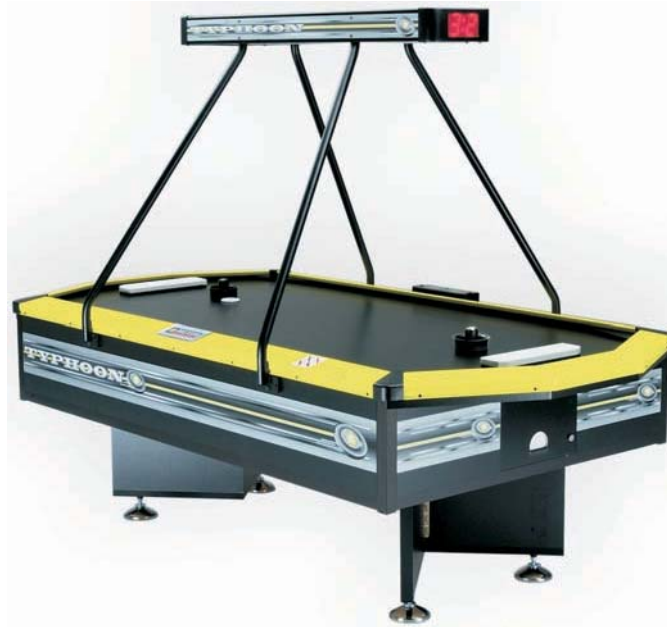
Modell "Typhoon Deluxe" TG-01-03-002-00