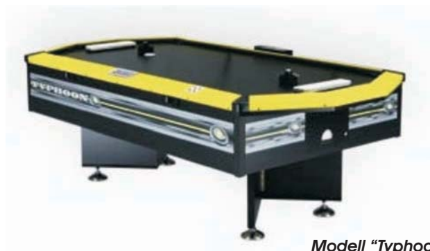
Modell "Typhoon" TG-01-03-001-00