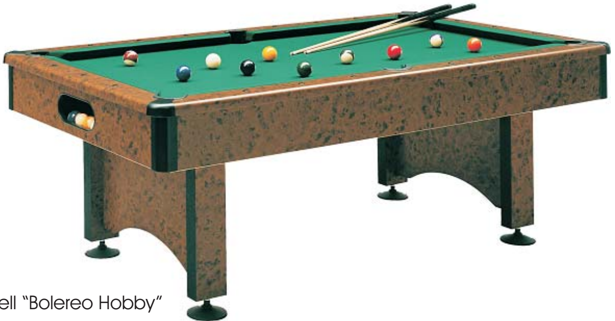
Modell "Bolereo Hobby"